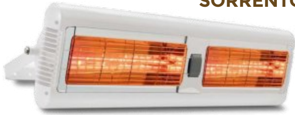
SORRENTO IP Double 2 x 1,5 kW