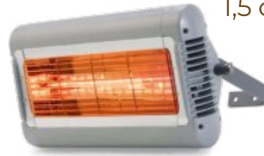
SORRENTO IP Single 1,5 od. 2,0 kW