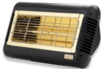
MONACO IP Single 1,5 kW