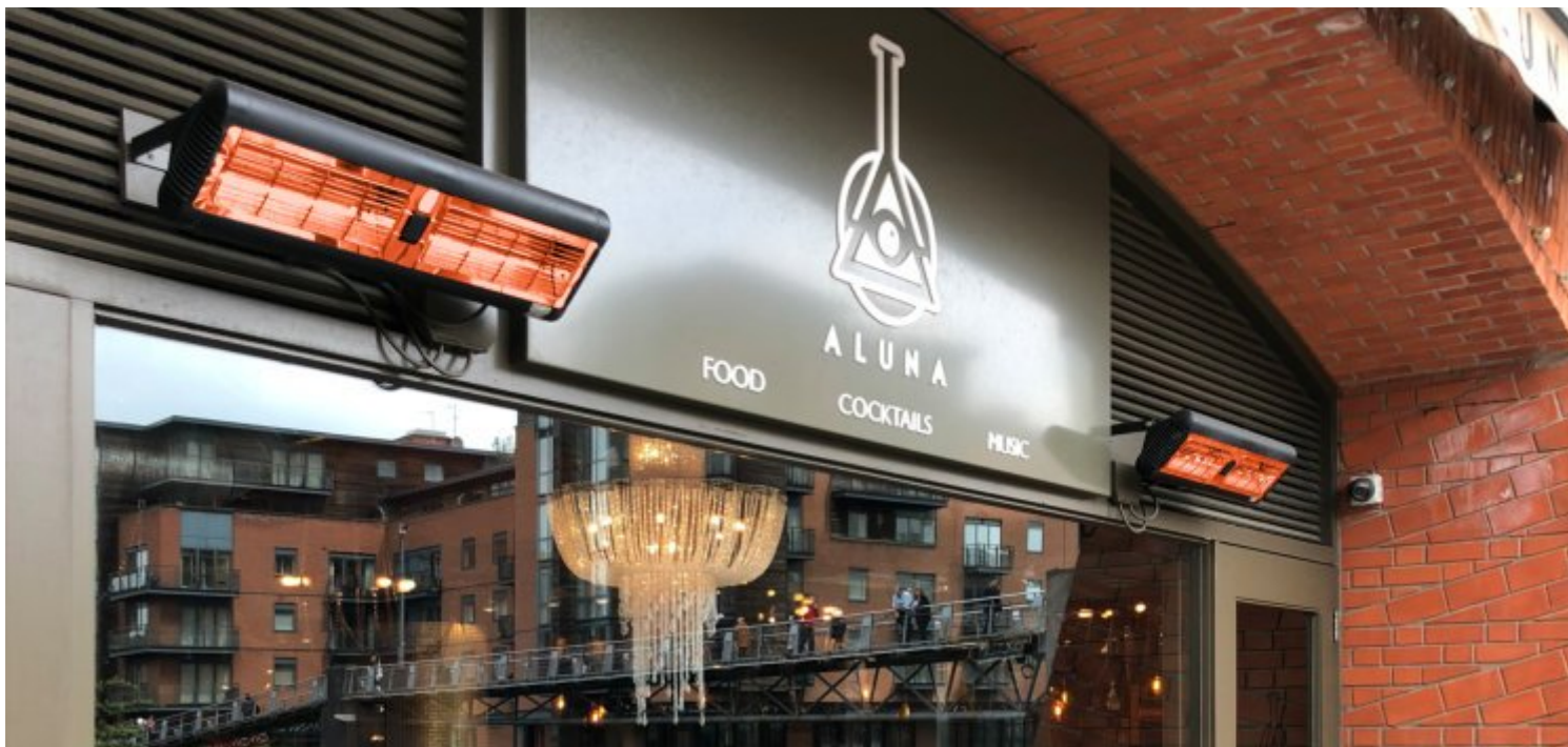
MONACO IP Single Empfohlene Montagehöhe: 2,0m

Großflächige Wärmeabgabe, bei Bedarf auch über Dimmer individuell regelbar. Bieten Sie Ihren Gästen die Möglichkeit zur dauerhaften Nutzung Ihrer Außengastronomie, im stilvollen Ambiente.